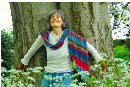
Natur- und Wildnispädagogin Systemische Homöopathie – Rituelle Räucherkunde