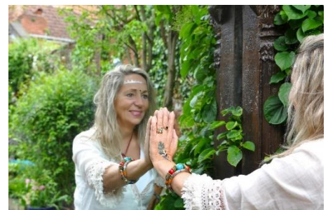
Astrologin – Schwingungstherapeutin Energetikerin - Fotografin